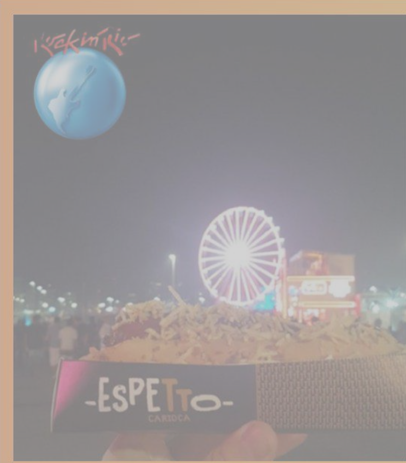
Rock in Rio