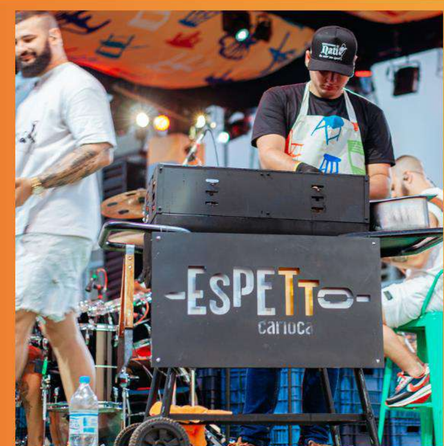
Churrasquinho MENOS É MAIS